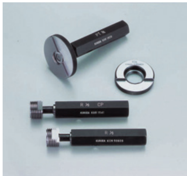
Rゲージの関係図 R gauges and related parts

Wear check is generally performed by using a set of newly manufactured gauges which have been stored as a master gauge to check for dimensional change of displacement at the small end.