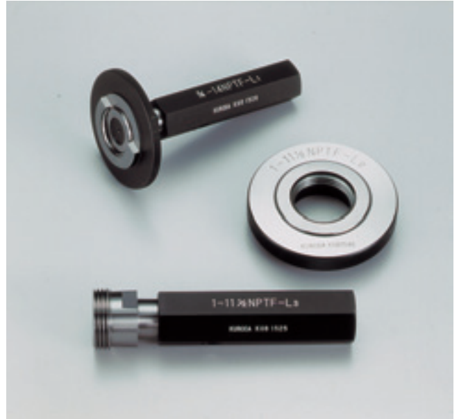
NPTFの関係図 NPTF and related parts

NPTF gauges of notch-less type conforming to American Standard (ASME) and 4-step notch type as well as those for the crest and bottom are manufactured upon request. Consult KURODA.